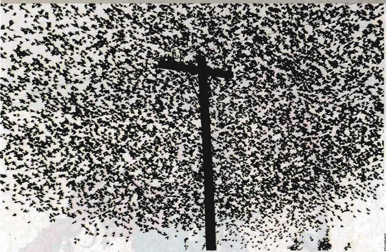
Graciela Iturbide, "Pajaros en el Poste de Luz. Carratera a Guanajuato", 1990.